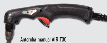
Antorcha manual AIR T30