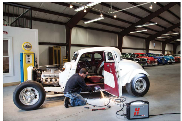
Reparación y modificación de vehículos